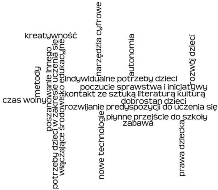
Schemat 2. Kompetentne dziecko i status dziecka, i dzieciństwa

w publikacjach Ewy Lewandowskiej i Jolanty Andrzejewskiej 49 , Marii Bulery i Krystyny Żuchelkowskiej 50 .